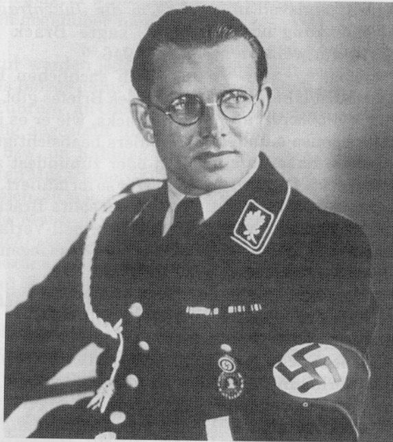
Reichsleiter der NSDAP Philipp Bouhler

"Wenn das der Führer wüßte" müßte man da sicher fragen. Für wen war Brack eigentlich tätig? Doch nicht für Himmler! Brack wußte, daß